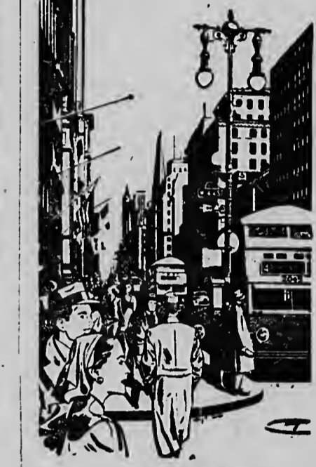
Toneel van Fifth Avenue voor goederen uit alle hoeken van de wereld uitgesteld liggen.

NEW YORK Met zoveel te zien en te doen zult U van elke minuut in deze fantastische stad genieten. Een Vacantie met Pan Am spaart U bovendien tijd en geld. Kies een van de vier centraal gelegen hotels van de beroemde Knott groep. Bij de "all-expense tours" zijn uitstapjes onder leiding van getrainde gidsen inbegrepen, eveneens kaartjes voor het theater, een bezoek aan een beroemde nachtclub en vele andere dingen.